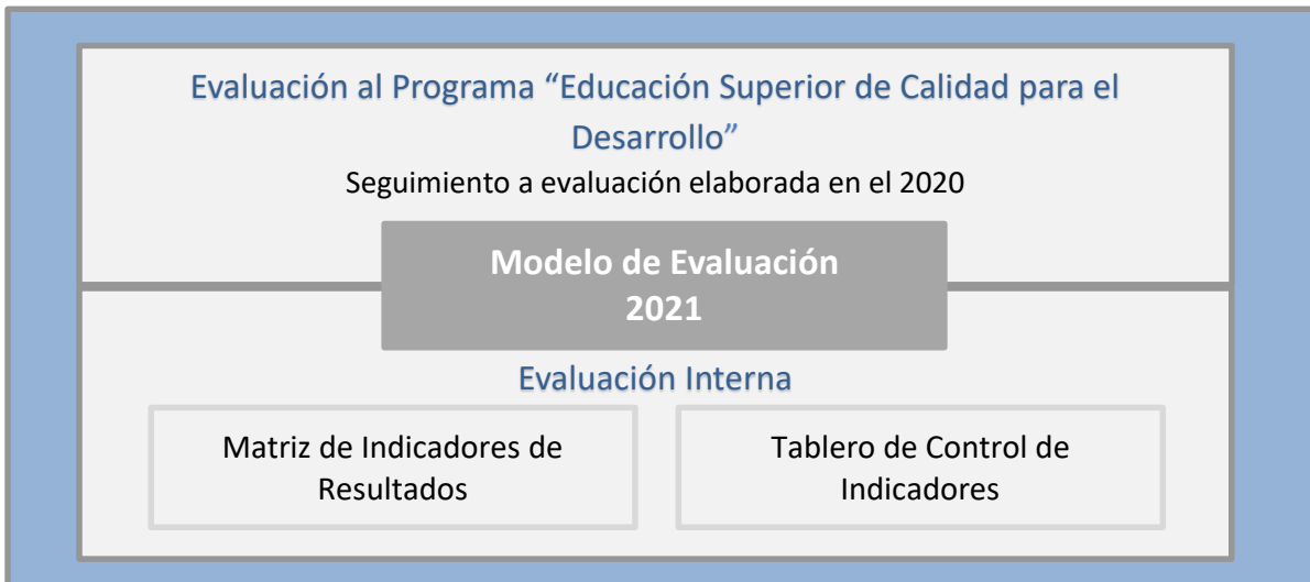
Figura 1. Modelo de Evaluación ITSON 2021