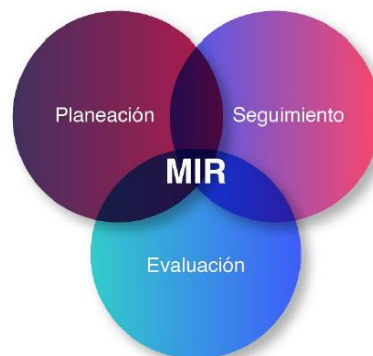
Figura 2. La Mir como instrumento de Planeación, seguimiento y evaluación

Para poder realizar lo anterior, la Institución tomará como base la Metodología del Marco Lógico, la cual, implica el análisis de la situación actual para establecer un problema, hasta culminar en el diseño de la Matriz de Indicadores de Resultados, en la que se establecerán los indicadores más relevantes para medir la contribución de la Institución al problema planteado. Cabe señalar que la utilidad de la MIR va más allá de la etapa de planeación, debido a que es una herramienta utilizada para llevar a cabo el seguimiento de los avances del programa, y se emplea como base para realizar las evaluaciones del desempeño (Secretaría de Hacienda y Crédito Público, 2019), lo cual puede observarse en la figura 2.