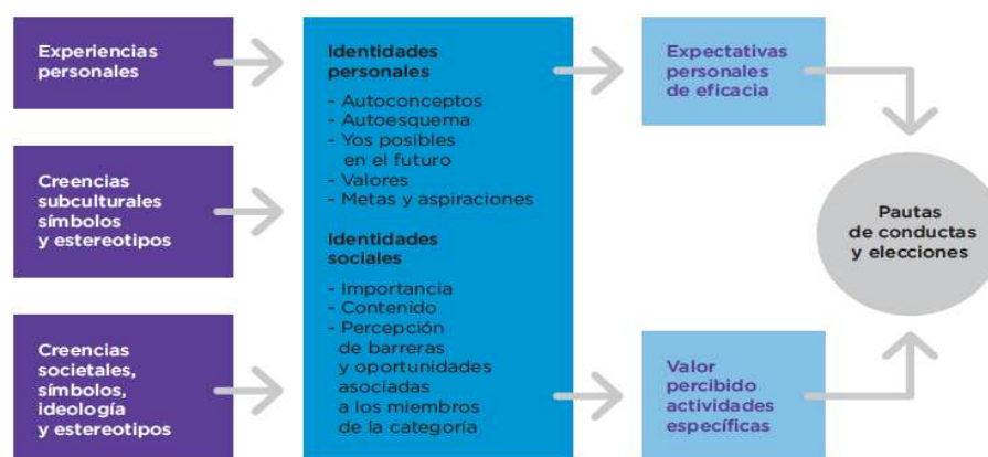
Figura 2. Modelo de elección de logro (Adaptación de Eccles, Barber y Jozefowicz, 1999, p. 169, citado por Sáinz, 2007).

Atendiendo al modelo de elección de logro (figura 2), tanto los acontecimientos pasados vividos por los individuos, como las experiencias previas de éxito o de fracaso, y otros factores culturales ejercen un efecto indirecto sobre las elecciones que estos realizan. Este proceso está mediado por las interpretaciones personales que los individuos hacen de las experiencias vividas, por la percepción de las expectativas de los otros, y por el proceso de identificación con las metas y valores en torno a los roles prevalecientes en el contexto sociocultural (Eccles, 1983; citado por Sáinz, 2007).