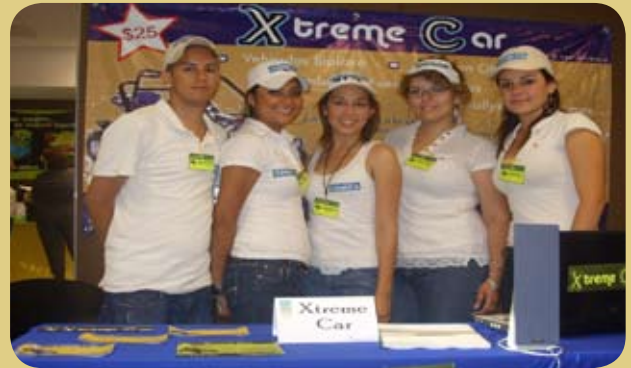
Exhibieron su Ingenio estudiantes de Guaymas en la feria empresarial "empréndete".