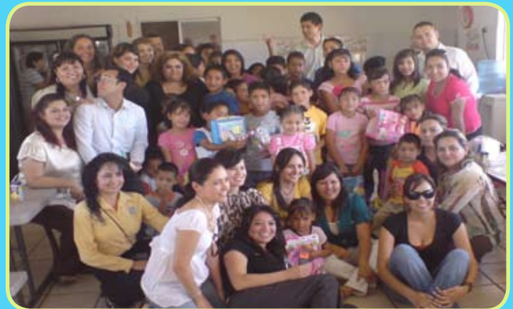
Cumple personal ITSON con estas acciones un compromiso humanista para compartir con los que menos tienen.

Ello se convierte en ejemplo y responsabilidad social con los sectores vulnerables de la población.