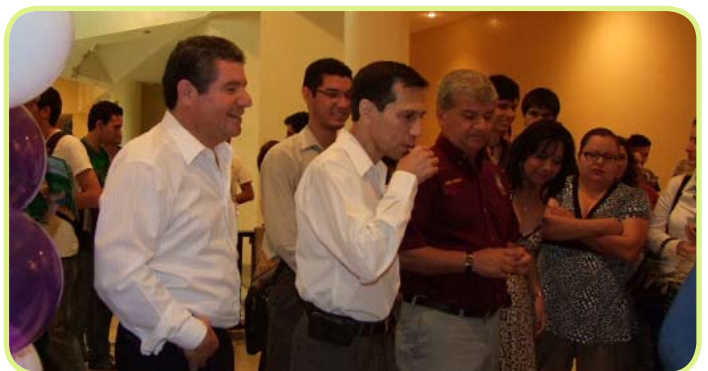
Autoridades de la Institución recorrieron cada uno de los stand.