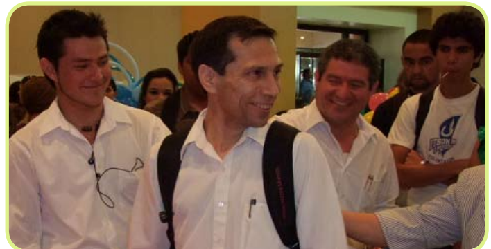
La aplicación de tecnología a productos de uso cotidiano fueron los elementos dominantes en esta exitosa Expo FERIA de Ideas Empresariales.