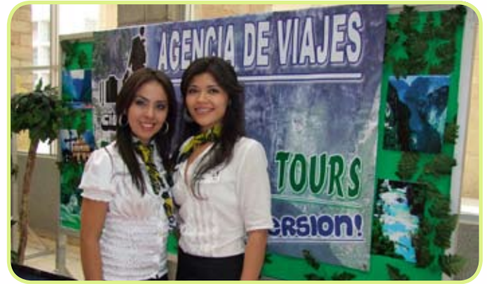
Alumnas de Licenciatura en Administración de Empresas Turísticas.

El evento se celebró para presentar agencias de viajes en diferentes destinos, tanto nacionales como internacionales, así como algunos que están enfocados al turismo local, doméstico, de negocios y ecoturismo.