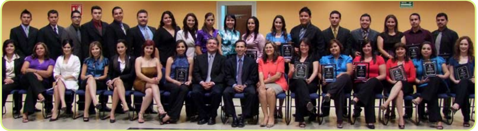
En el evento de Egresados Distinguidos 2007-2008, se reconoció a 27 alumnos de licenciatura y 7 de maestrías.