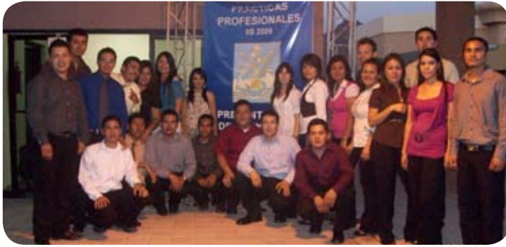
Estudiantes de Ingeniería Industrial de Guaymas presentaron sus proyectos a la comunidad.