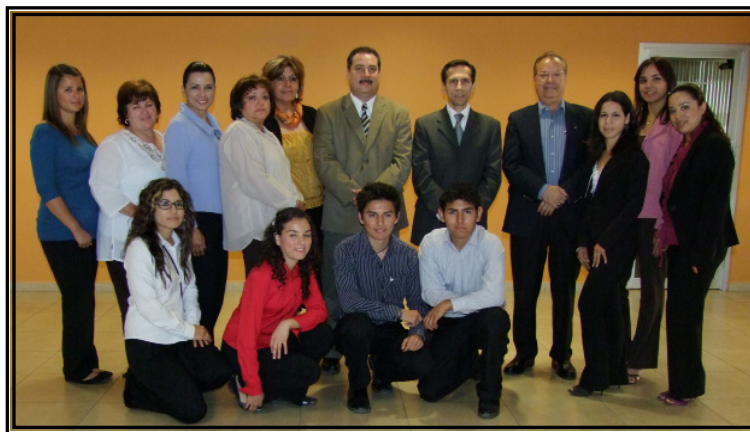
Los alumnos del Programa Jóvenes Voluntarios también tomaron protesta ante las autoridades de la Institución.