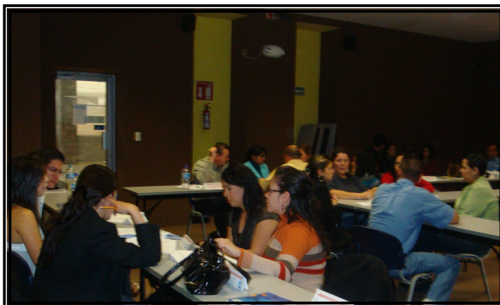
Curso “Norma ISO 9001:2008”.