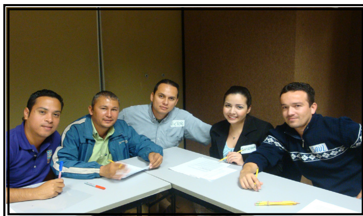
Curso “Calidad en el servicio”.

Por último, personal de las áreas de Laboratorios y Audiovisuales, Contraloría Interna, Obras, Contabilidad y Personal, formaron parte de un curso acerca de la “Norma ISO 9001:2008, Sistema de Gestión de la Calidad: Requisitos”, en esta capacitación se les explicó de manera general a los participantes los componentes de un Sistema de Gestión de la Calidad de acuerdo a la Norma ISO 9001:2008, misma que deben mantener todos los departamentos de ITSON para un mejor servicio.