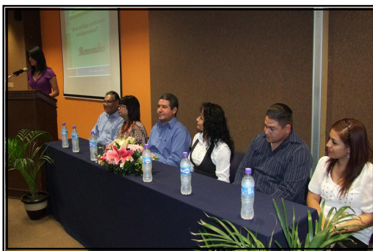
Presidium del día del psicólogo.