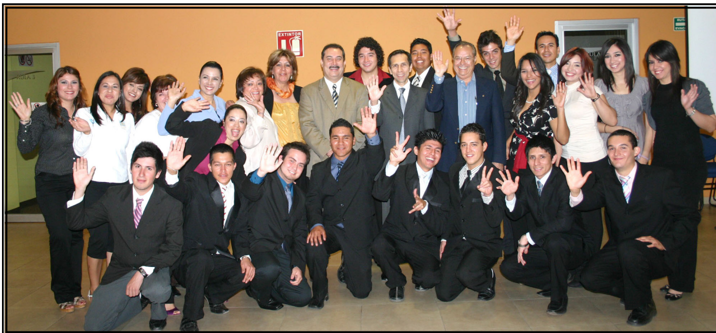
Nuevos retos le esperan al equipo SIFE-ITSON en la próxima competencia nacional a celebrarse en el mes de Junio en México D.F.

Comprometidos con el apoyo a la comunidad y a su Institución, tomaron protesta el equipo SIFE-ITSON 2010 y el Programa de Jóvenes Voluntarios.