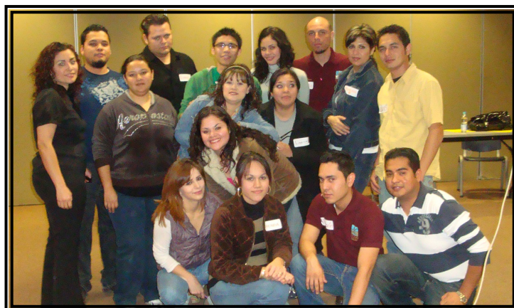
Curso “Trabajo en equipo”.