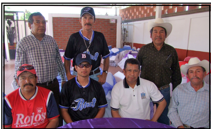
Los asistentes al evento disfrutaron de un evento de camaradería y sana convivencia.