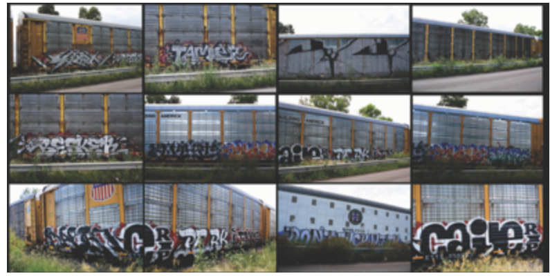
Recorrido fotográfico del ferrocarril, octubre 2015, Aguascalientes. Técnica digital. Archivo de la autora.

Más allá de mis propósitos de conocer las manifestaciones del registro fotográfico, pude llegar más lejos de lo imaginable, la convivencia con los productores fue lo más importante, ser testigo de sus ideas, sus historias sus dimensiones y sobre todo de sus ganas de querer seguir produciendo a pesar de cualquier circunstancia adversa. También el acudir al ferrocarril y recorrer vagón por vagón de manera clandestina para su registro fotográfico, me hizo comprender la práctica del graffiti en otra dimensión, aquella que nos es ajena y que no alcanzamos a entender si nos remitimos a buscarla solamente en los textos; solo la sentimos y la conocemos si estamos presentes en la acción, si conseguimos sentirnos insignificantes y minúsculos ante ese gigante de acero, si al igual que ellos nos sometemos a esa vulnerabilidad, a los peligros inherentes de la acción, solamente así se congrega a esa dimensión.