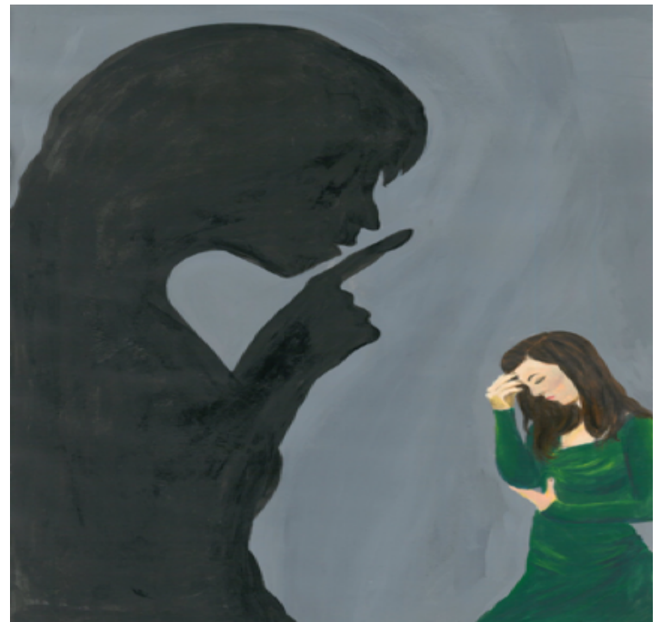
Imagen 1. Beatriz Belchior, Bernarda y Adela. Técnica mixta, 2018.

Pero, ¿qué lectura podríamos hacer de La casa de Bernarda Alba desde Londres en este 2018?. Sin lugar a dudas esta obra nos representó, inicialmente, un desafío debido a su complejidad temática así como a la distancia que se ha forjado entre las sociedades modernas. Parecería entonces, increíble, que un hecho tal pudiese suceder a día de hoy ya que en una sociedad como esta la legislación vigente hubiese salvaguardado la integridad psico/emocional de las hijas brindando apoyo para su independencia. Es increíble que un hecho totalmente aceptado en los años treinta pudiera parecer ahora, incluso ilegal.